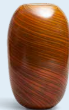
Mathieu Casseau - "Vase" - H36 cm x D20 cm