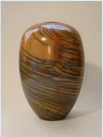
Mathieu Casseau - "Vase" H30 cm x D20,5 cm