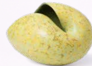
Sangwoo Kim - "Breeze" - H29 x L46 x D29 cm